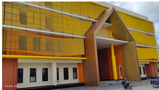
QR Code สถานที่ สอบ

วันที่สอบ: วันอาทิตย์ที่ 15 กันยายน 2567 สถานที่สอบ: ห้อง ST-201 อาคารเรียนรวม ST มหาวิทยาลัยวลัยลักษณ์ ตำบลไทยบุรี อำเภอท่าศาลา จังหวัดนครศรีธรรมราช 80160